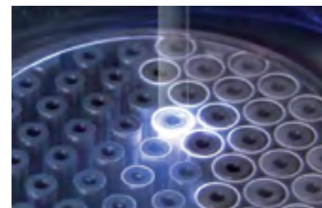
脆性材料激光切割

激光刻蚀技术用于生产薄膜太阳能组件和晶硅太阳能电池，以及各种其他技术领域。Manz 提供具有高产能的完整划线系统产品组合，可用于玻璃和柔性材料的薄膜刻蚀、PERC 高效太阳能电池生产中背面钝化层的开口以及典型晶圆尺寸工件的其他工艺。对于平板和触摸屏应用，Manz 提供高达 2.6 m x 2.2 m 基板尺寸的最大产能划线系统(8.5 代)。